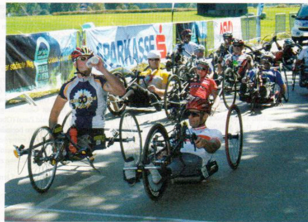
Teilnehmer der ÖM Behinderten-Radstraßenmeisterschaft

Bei der Generalversammlung wurde auch ein neuer Nachwuchstrainer vorgestellt Winfried Fuchs wird ab Anfang April das Trockentraining für die Schüler übernehmen und unter fachkundiger Anleitung wöchentlich abhalten. (Info unter 04852-63820-22 DW oder 61279). Kinder ab 7 Jahre können gerne auch einmal ein „Schnuppertraining“ absolvieren und testen, ob sie für den Triathlonsport geeignet sind.